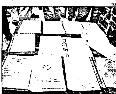
CON GAME: Five men were held for giving dud certificates to private sector job-seekers